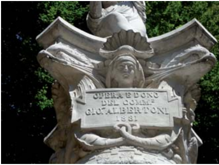
Abb. 13: Detail der Delfin-Fontäne, errichtet zur feierlichen Eröffnung des fertiggestellten Sacro Monte di Varallo, 1881.