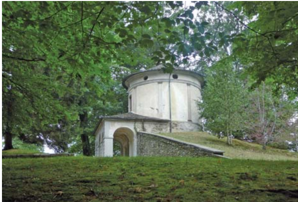
Abb. 5: Sacro Monte di Orta.

Es ist hier nicht mein Ziel, für den einen oder den anderen Heiligen Berg zu argumentieren. Denn Sacro Monte ist das Wort für die Wahrscheinlichkeit einer Welt des Heiligen, einer Hyperrealität avant la lettre , gemäß dem Sinn, den Jean