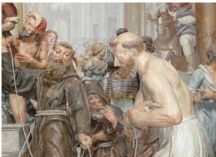
Abb. 6: Franziskaner spielen den heiligen Franziskus [Demut], Orta.