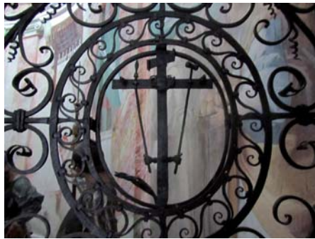
Abb. 10: Schmuckgitter auf dem Sacro Monte di Orta. Foto: Autorin, 2010

Vorausgesetzt wird, dass wir den fraglichen Ort in einem ausdrücklich phänomenologischen sowie hermeneutischen Kontext betrachten, der uns aus dem Text herausnimmt – und aus den voyeuristischen Vorstellungen eines mehr oder