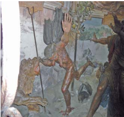
Abb. 16: Detail (links)

Gemäldes über und hinter den Skulpturen. In der Tat hat die Präsentation der Figuren auf der unteren Ebene der Tafel eine fast cinemaskopische Wirkung. Diese vielfarbigem Terrakotta-Figuren werden vor Ort als „ Satana-Demoni “, will sagen Teufel oder Dämonen, bezeichnet: Man beachte das gebogene Bein und den gespaltenen Fuß des weglaufenden weiblichen Teufels links in Abb. 15 (sowie den Ausschnitt dieser Figur in Abb. 16). Während die Engel auf der rechten Seite, ebenfalls als Paar wiedergegeben, männlich sind (und demzufolge, gemäß augustinischer theologischer Tradition, quasi-kastriert oder a-sexuell), sind die gemalten Teufel nach der in Italien populären Weise weiblich (die Fassade der Jesuskirche (Il Gesù) in Rom weist als bildhauerisches Element einen solchen weiblichen Teufel auf.) Die sinnliche Begierde bildet das Zentrum der Versuchung des heiligen Franziskus. Eine Seite des Raumes ist dunkel, die andere erleuchtet, und wir erinnern an die Rolle Satans als göttlicher Kreatur (so heißt es bei Goethe, Mephisto sei der, der stets das Böse will und stets das Gute