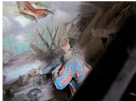
Abb. 12: Gitterschatten, Vision des hl. Franziskus, Orta. Foto: B. Babich, 2010

Aus all diesen Gründen muss man auf die Konventionen der perspektivischen Erfahrung hinweisen, die immer Gepflogenheiten im Spiel der jeweiligen Zeit sind.