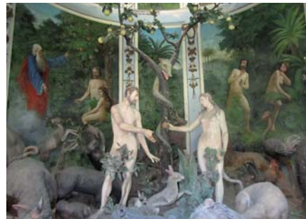
Abb. 7: Schöpfung, Kapelle I, Varallo.