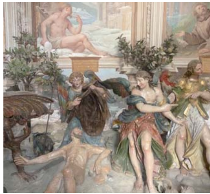
Abb. 17: Detail (rechts)

10. Kapelle, Di Tentazioni di san Francesco Sacro Monte di S. Francesco, Orta. Foto: B. Babich, 2010