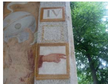
Abb. 2, 3: Sacro Monte di Orta, Decke des Portikus, Innen- und Außendetail.