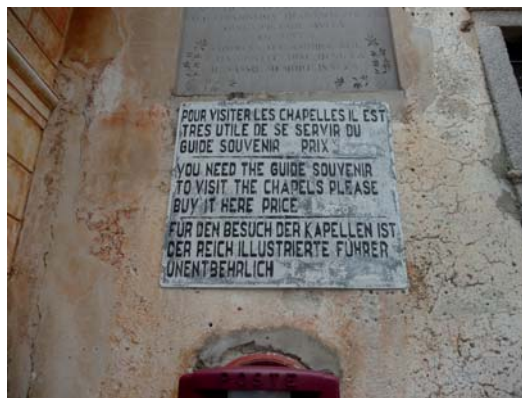
Abb. 8: Außendetail, Kapelle II, Sacro Monte di Orta.

Die Verkomplizierung der Sache durch die Verwendung der Sprache, sei es von Nietzsche oder Lou, eines „Traumes“, der uns „fesselt“, kommt daher, dass es sich bei den Ausblicken, die sie bieten, um dreidimensionale Ausblicke in voll-