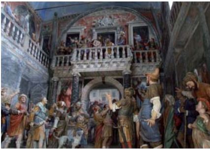
Abb. 14: Ecce homo, Sacro Monte di Varallo

nur als Zutat zu der hermeneutischen Herausforderung im Blick auf Nietzsche. 43