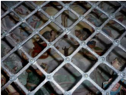
Abb. 11: Gitter, Vision des hl. Franziskus, Orta. Foto: B. Babich, 2010

angebracht sind, die zentrale Position widerspiegeln, und zwar über bestimmte Konstruktionselemente und ganz offenkundig über Größenunterschiede, die bisweilen spezielle Blickpunkte enthalten, durch die der Betrachter die beste Aussicht gewinnt. Auf alle Fälle ist die Wirkung dieser holz- oder auch schmiedeeisernen Gitter die, Nähe zu erzwingen. 40