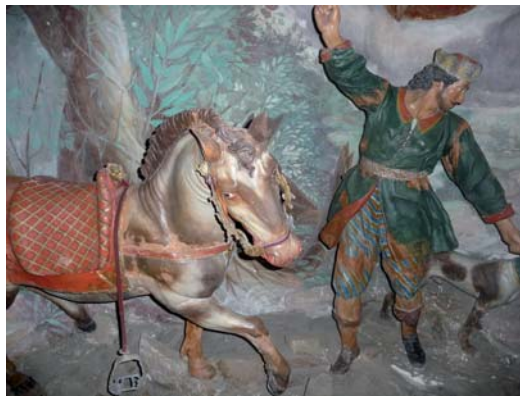
Abb. 9: Kapelle XI, Detail aus Der Gekreuzigte spricht zum Heiligen Franziskus , Orta.

Wie Heelan schreibt, und wie Kunsthistoriker das immer machen konnten (auch wenn sie es bislang im Allgemeinen eher nicht getan haben), sind perspektivische Zeichen nicht nur Konventionen einer Kultur oder einer Zeit, sondern sie hängen zugleich von der besonderen Geometrie einer Vorstellung ab, die sich als deutlich nicht-euklidisch erweist, was zu Schwierigkeiten für geometrische Entwürfe führt. Hier setze ich phänomenologisch voraus, dass eben dies in einem