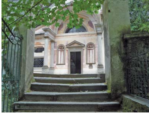
Abb. 1: Eingang zum Sacro Monte di Orta.

sich aufnimmt, was zu sehen ist. In dieser Hinsicht bieten sowohl Orta als auch Varallo eine fantastische Gelegenheit für das, was man das Wunder des Einblicks in einen metaphysischen Bereich nennen könnte: Die übergeordnete Welt erscheint als ein Teil der darunter gelegenen, die vergangene sowie gegenwärtige Welt wiederum erscheinen im Lichte der Ewigkeit, der Fülle der Zeit.