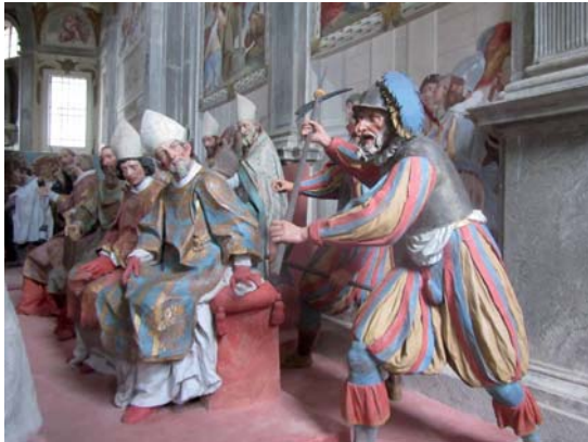
Abb. 4: Sacro Monte di Orta, Heiligsprechung des heiligen Franziskus. Foto: B. Babich, 2010

Dabei ist zu betonen, dass zusätzlich zu der klassischen oder ‚heidnischen‘ Symbolik, die die Wände ziert, die reich bemalten Terrakottafiguren den vielfarbigen alten griechischen Statuen ähneln, die Nietzsche in seinen öffentlichen Vorlesungen in Basel als ein unverzichtbares Korrektiv zu der populären Winckelmann'schen Auffassung von einem klassisch weißen, reinen oder schlechthin unbemalten Altertum ins Spiel bringt. 20